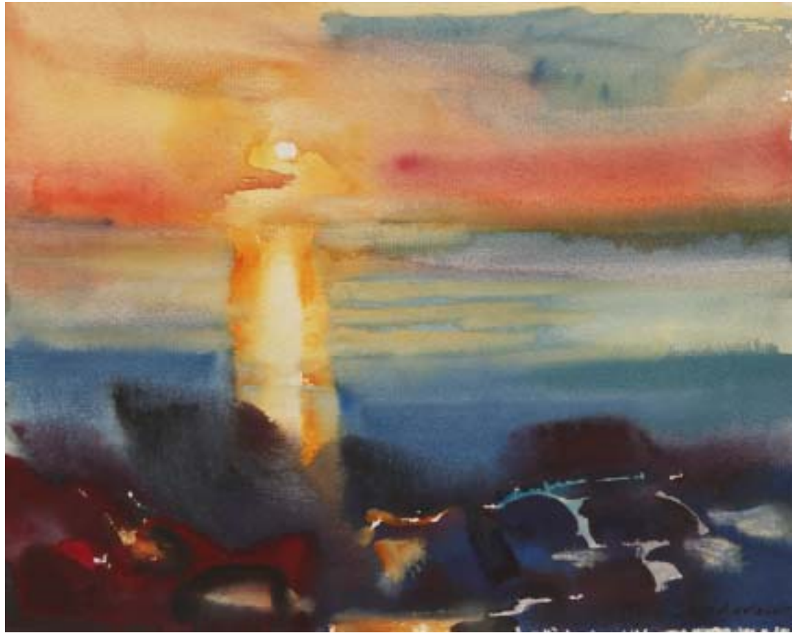
Midnattensol, Mevik, Norge