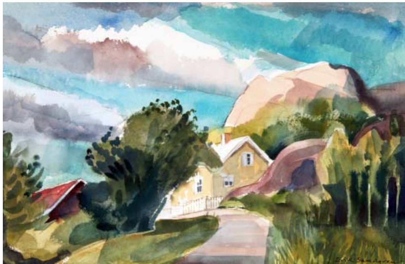
Täfteå, utanför Umeå