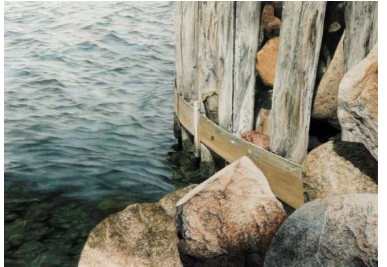
Sommar i Dragör