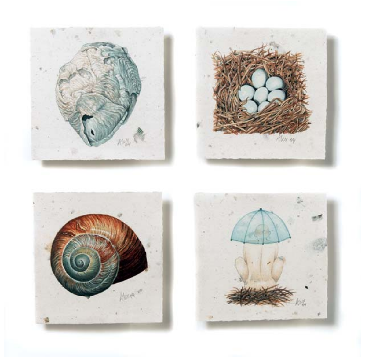
Svenska Hem III