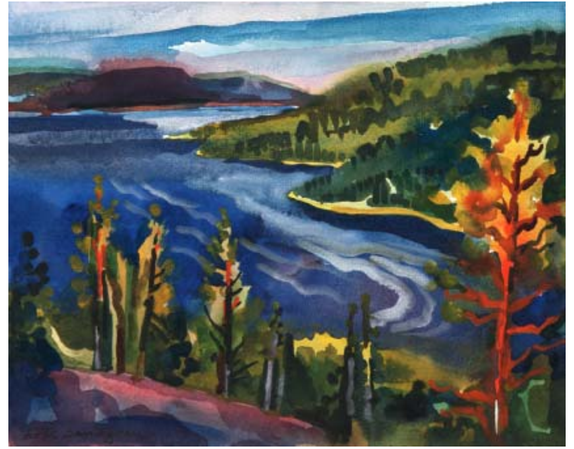
Höga Kusten, Ullångersfjärden